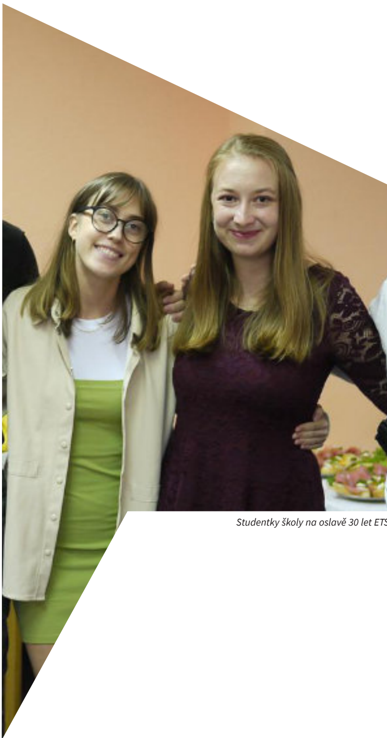
Studentky školy na oslavě 30 let ETS