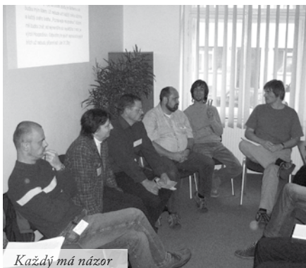
Každý má názor

Práce, studium, zábava – skoro jako v ráji :-)