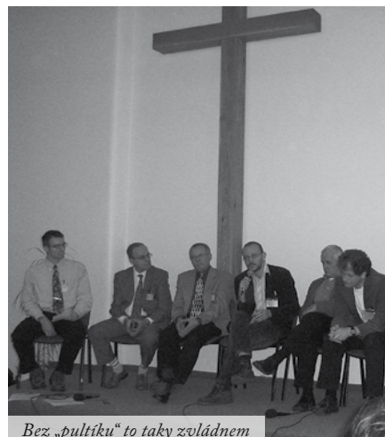
Bez „pultíků“ to taky zvládnem