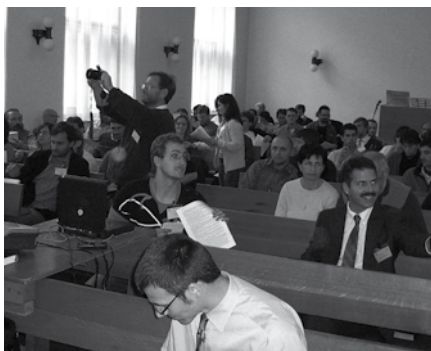
Někdo fotí, někdo se připravuje a někdo přichází