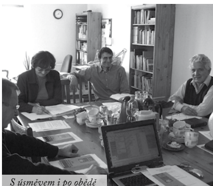
S úsměvem i po obědě