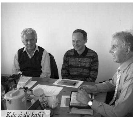
Kdo si dá kafe?