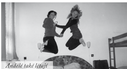
Andělé také létají