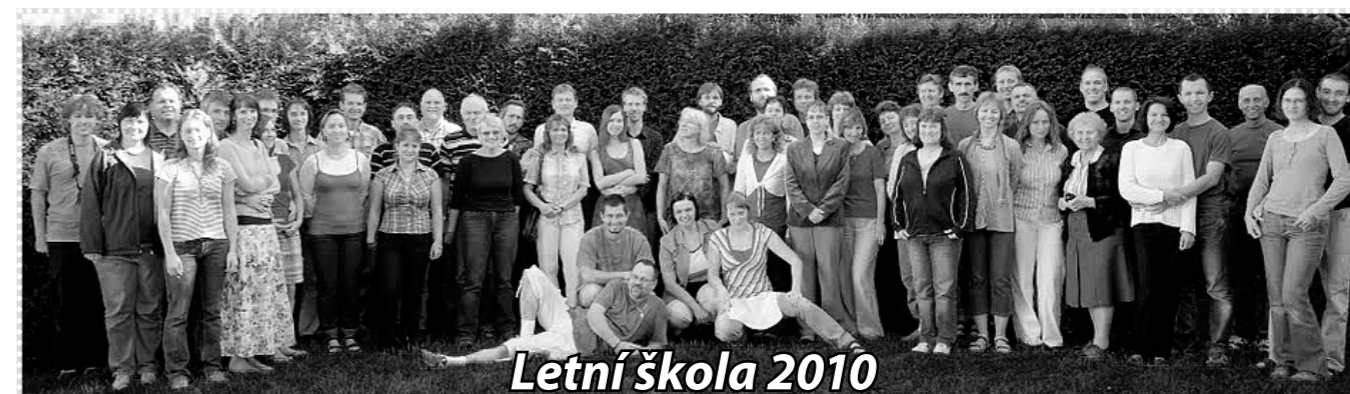
Letní škola 2010