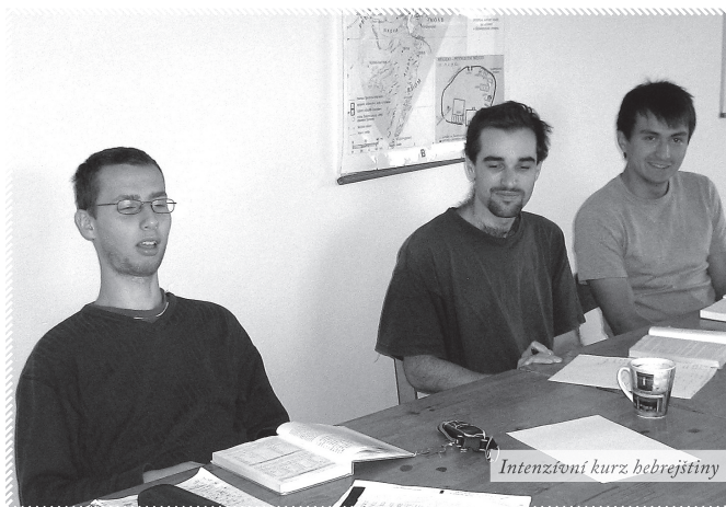
Intenzivní kurz hebrejštiny