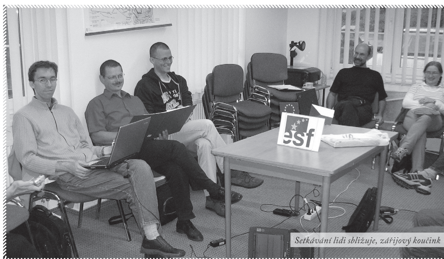
Setkávání lidí sblízuje, zářijový koučink