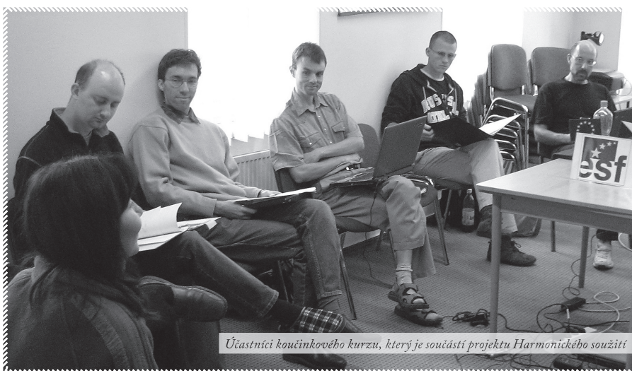
Účastníci koučinkového kurzu, který je součástí projektu Harmonického soužití