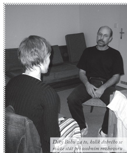
Díky Bobu za to, kolik dobrého se může stát při osobním rozhovoru