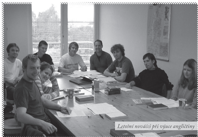
Letošní nováci při výuce angličtiny