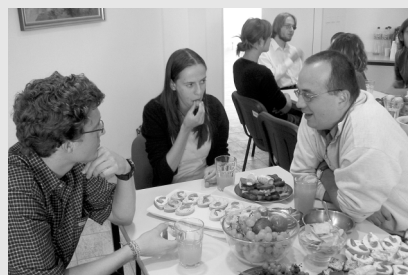
12 o - 14 o oběd + rozhovory