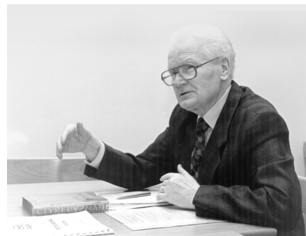
bratr musel napomínat. Ale vzpomínám na tyto přednášky moc ráda – děkuji, bratře!

Bohužel nemožu říct, že bychom se při hodinách církevních dějin zázrakem měnili v dokonalé studenty. Někdy jsme byli unavení, taky líní, zlobili jsme a občas vyrušovali tak, že nás