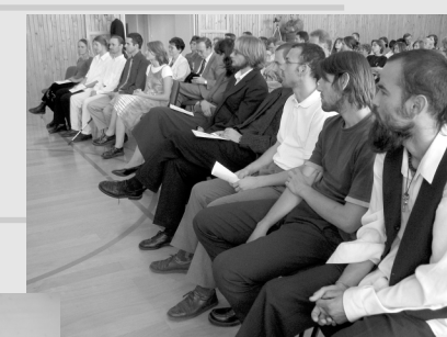
14 o - 16 o slavnostní shromáždění