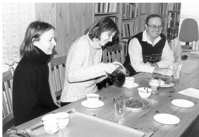
Den otevřených dveří