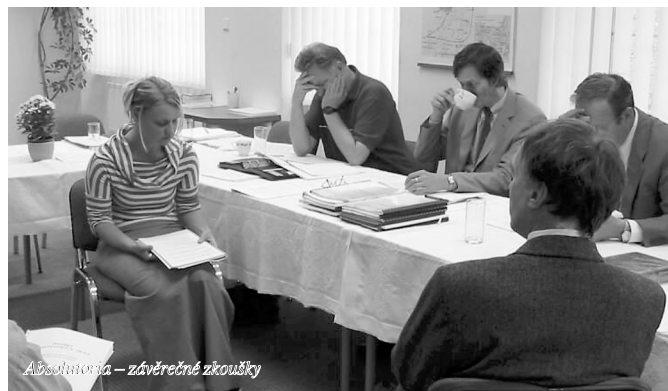
Alfabetizace – závěrečné zkoušky