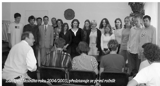
Zahájení školního roku 2004/2005, představuje se první ročník