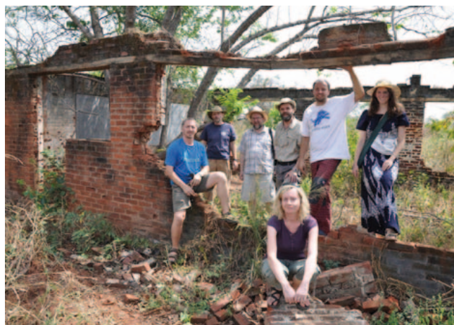
Budoucí biblická škola v Jižním Súdánu

doucí mládeže, muži i ženy, mladí i staří, po desítkách, i přes sto najednou. Touto formou ale není možné se systematicky, dlouhodobě věnovat jednotlivcům.