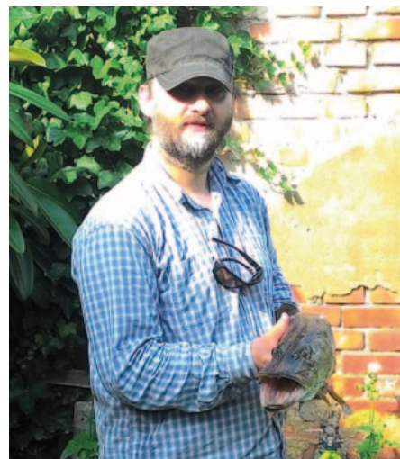
Štika byla tak velká, že se na fotku vešla jen při pohledu zpředu

Největším pozhledáním ETS jsou lidé, kteří zde pracují a studují. Líbí se mi, jak jsme si na ETS blízko. Jedním ze symbolů je pro mě jídelní koutek a kuchyňka v oddělení kanceláří – tolik věcí se zde probralo u jídla s kolegy a kolegyněmi, nápady se rojily, vtipy pršely, studenti se zastavovali na kus řeči, na pokračování exegetické diskuze, s pozvánkou na svatbu nebo aby si v kuchyňce pro zaměstnance ukradli hrnečky či přístroje. Dokonce i toaleta je zde strategicky umístěná tak, že v případě potřeby nezměškáte nic ze zajímavé diskuze kolegů u jídelního stolu.