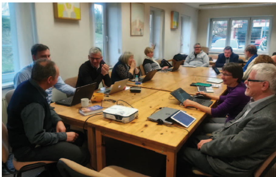
Pracovní setkání editorů a autorů komentáře na ETS

Kromě běžné organizační agendy bylo přínosné setkání s několika zástupci místních církví, sborů a křesťanských institucí. V průběhu neformální diskuze se znovu a znovu vynořovaly klíčové otázky tohoto komentářového projektu: Co vlastně máme společného? Lze říct, že čteme Bibli v nějakém slova smyslu stejně či alespoň podobně? Bude komentář z pera polského komentátora přínosný pro čtenáře dejme tomu v Černé Hoře? Jeden konkrétní výstup z této diskuze se týkal většího zapojení rakouských biblistů, kterého bychom chtěli dosáhnout – nakonec, do značné míry je náš region ovlivněn právě společnou c. a k. historií. Připomínáme opět, že kromě komentáře budou součástí svazku také kratší i delší články na vybraná témata, která spojují biblická témata s aktuálními otázkami církve a společnosti ve středo- a východoevropském regionu. Garantem projektu je organizace Langham Partnership založená Johnem Stottem.