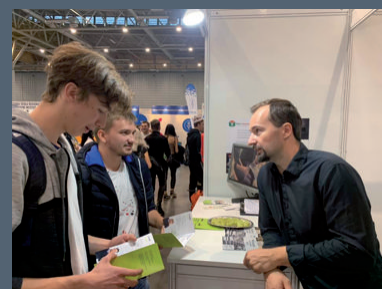
Stánek ETS na veletrhu škol